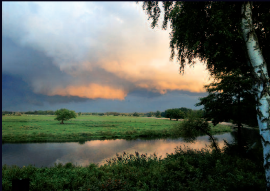
Ob das Wetter gut oder schlecht ist, hängt von der Umgebung ab.