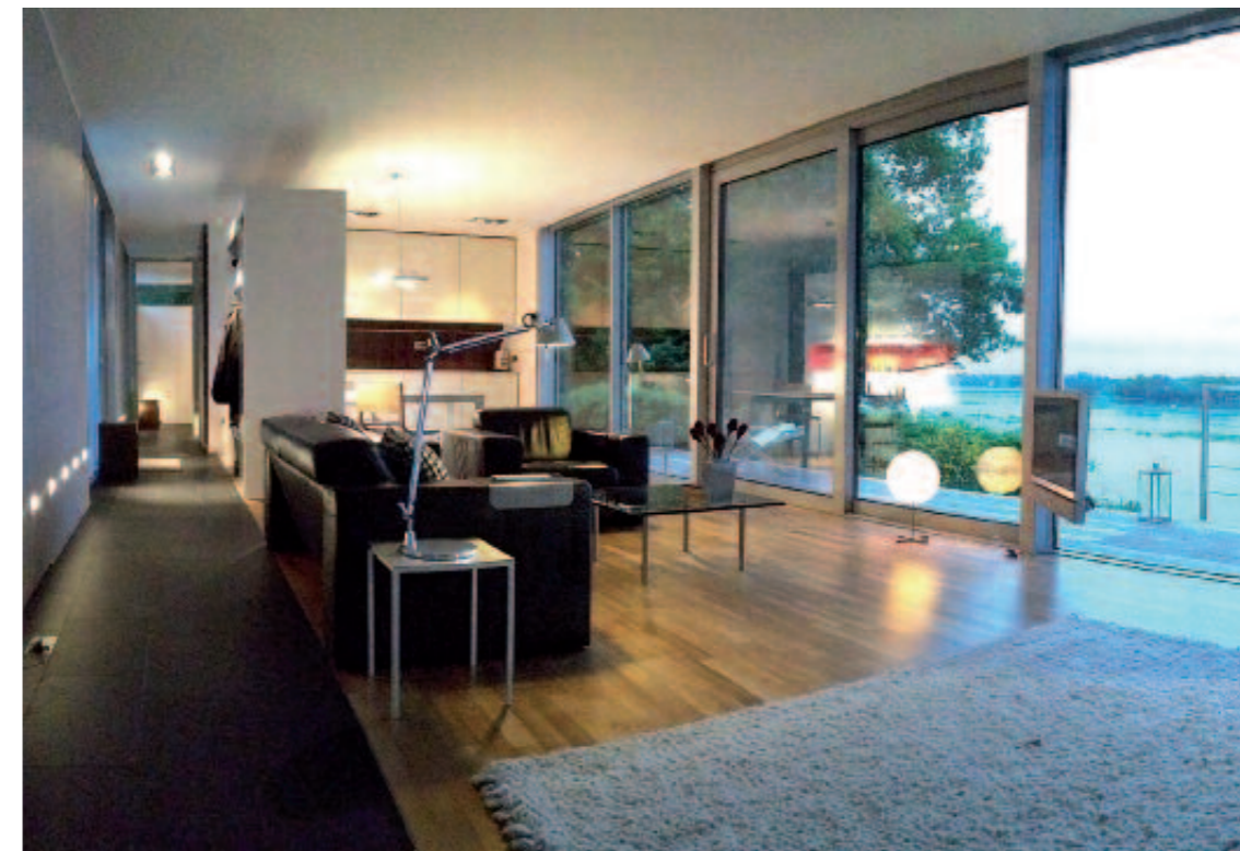
„Die Natur muß gefühlt werden.“