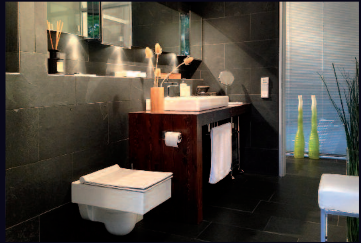
„Wohnen sollte nicht im Bad aufhören“