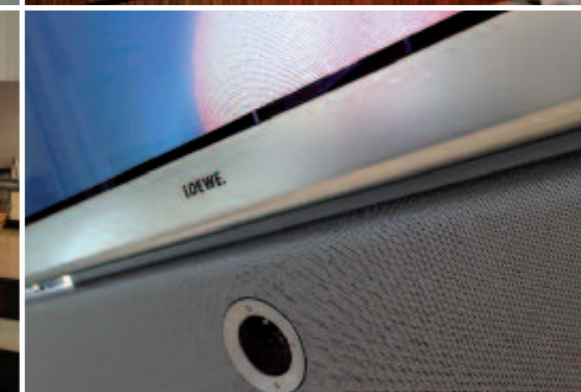
Ein Genuss für alle Sinne.