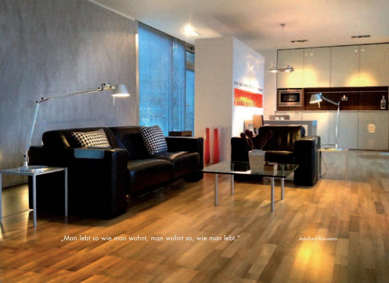
„Man lebt so wie man wohnt, man wohnt so, wie man lebt.“